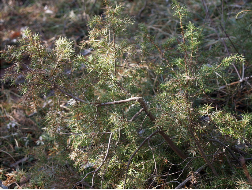
Bild 06: Juniperus communis _ Nr. 06 in der Fundortkarte = auf dem Hauerberg, etwa 400 m nordwestlich vom Froschstein – 27. November 2009