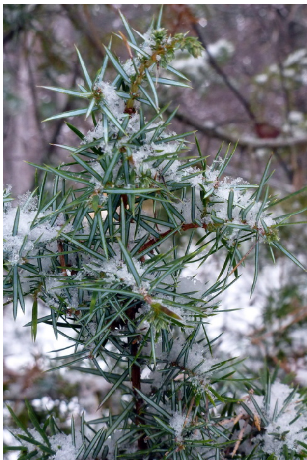
Bild 01: Juniperus communis _Nr. 04 in der Fundortkarte = unterhalb des Jubiläumskreuzes_8. Dezember 2012

Die Karte zeigt Fundorte von Wacholder / Juniperus communis innerhalb des Gemeindegebietes von Bad Vöslau. Gekennzeichnet sind alle Stellen, an denen der Autor dieser Seite bei seinen Erkundungsgängen in den letzten 10 Jahren Wacholderbüsche oder -kleinbäume angetroffen hat. Auch wenn es wohl noch den einen oder anderen noch nicht kartierten Strauch dieser Art auf dem Gemeindegebiet geben wird, zeigt die Karte anschaulich, dass der Wacholder auf dem Boden unserer Heimatgemeinde eine sehr seltene Gehölzart ist. pdf mit höherer Auflösung hier