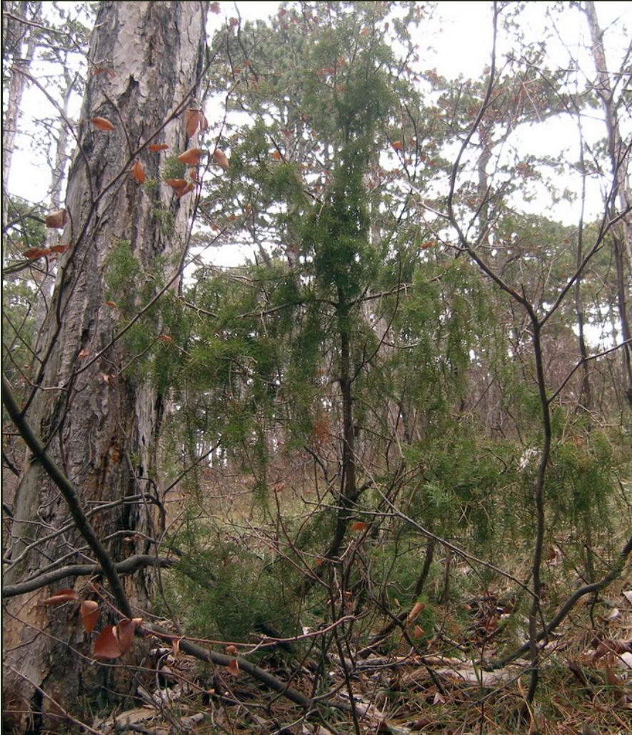
Bild 05: Juniperus communis _ Nr. 05! in der Fundortkarte = einer von zwei Wacholderbüschen im Schwarzföhrenwald, etwa 100 m südöstlich vom Parkplatz bei der Vöslauerhütte _8. März 2009