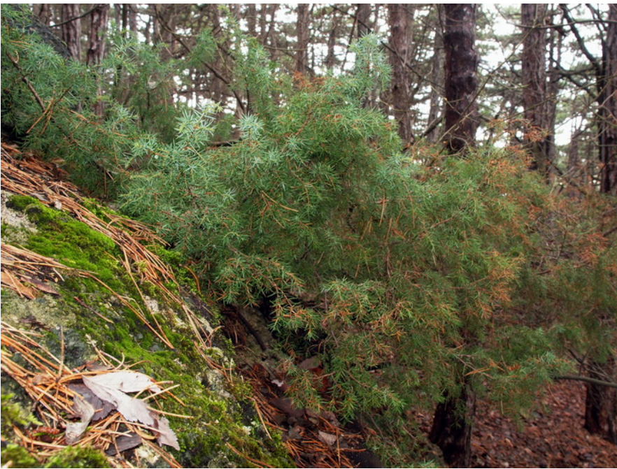
Bild 03: Juniperus communis _Nr. 03 in der Fundortkarte = nahe dem Jubiläumskreuz bei der Vöslauerhütte_7. März 2012 und 16. Dezember 2012

Bild 02: Juniperus communis _Nr. 18 in der Fundortkarte = auf einem Felsen 70m etwa südlich des Steinernen Kreuzes_16. Dezember 2012