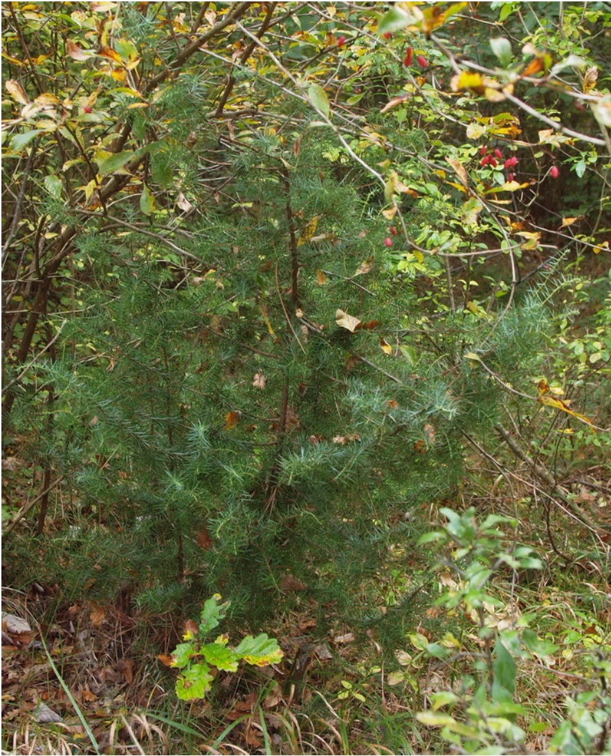
Bild 08: Juniperus communis _ Nr. 12 in der Fundortkarte = in einem lichten Eichen-Linden-Mischwald am Weg zum Scheiterboden_11. März 2012