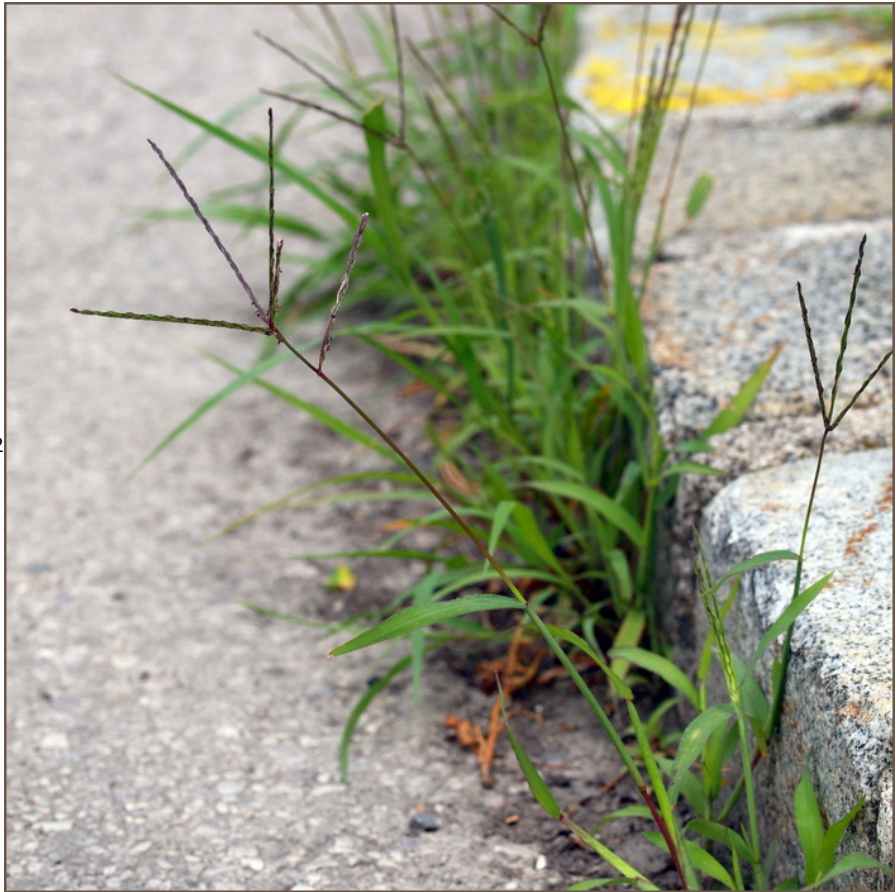
Digitaria sanguinalis : Millöckergasse, 18.07.2012