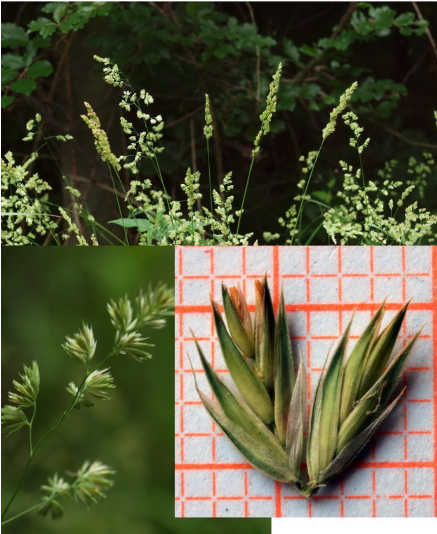
Wald-Knauelgras / Dactylis polygama 06 Haidelhofewald, 08.07.2012a