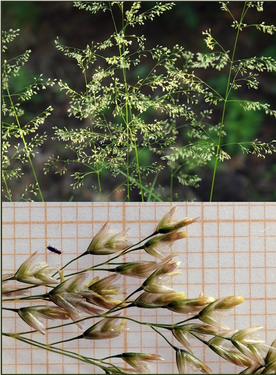
Horst-Rasenschmieie / Deschampsia cespitosa 03 Rohrwiese, 16.06.2003