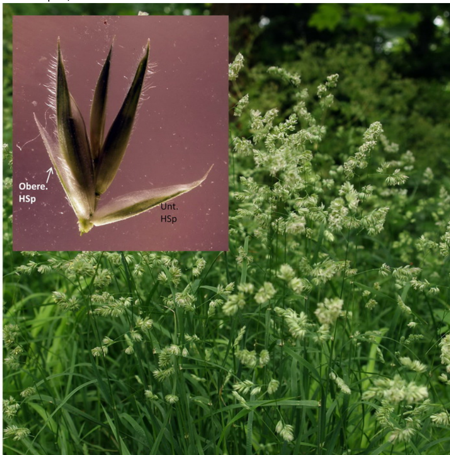
Wald-KNäuelgras / Dactylis polygama 05