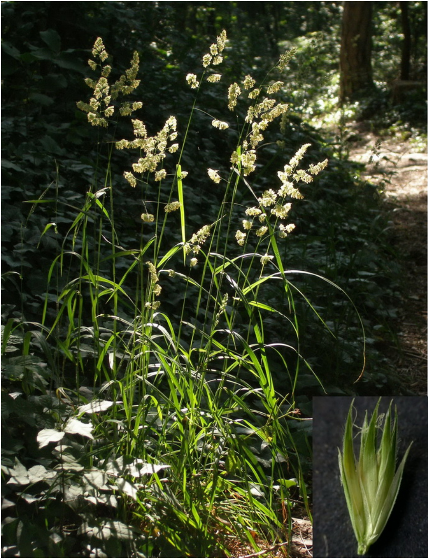
Wald-Knaujgras / Dactylis polygama BILD 02. Haidhoferwald, 19.07.2015