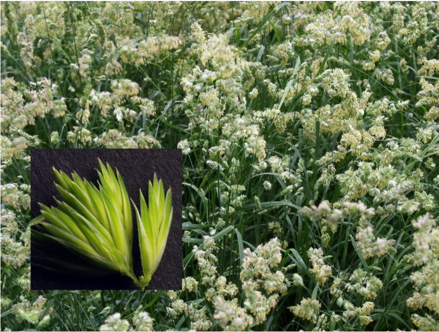
Wald-Knauelgras / Dactylis polgama 04 Tremelhofpark, 06.06.2009