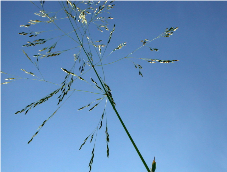
Horst-Rasenschmiele / Deschampsia cespitosa 04 Totenkopfwald, 21.09.2008