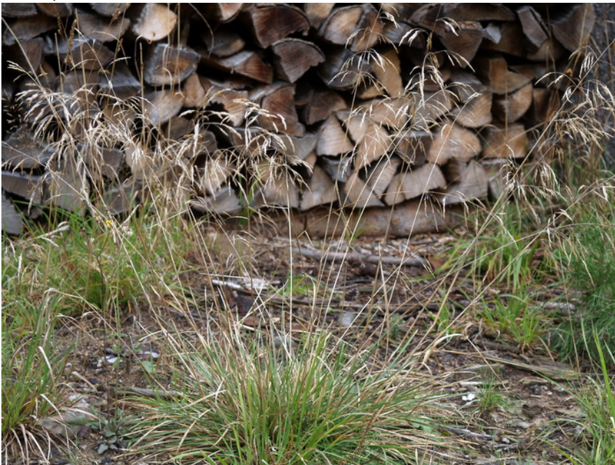
Blut-Fingerhirse / Digitaria sanguinalis BILD 01 In November 2012, Bild 18 bis 20