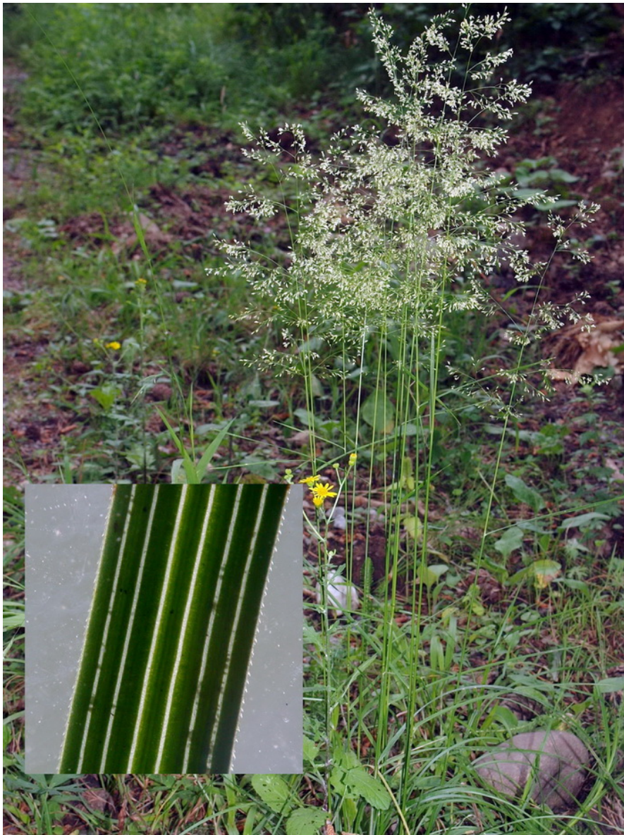
Horst-Rasenschmiele / Deschampsia cespitosa 02 Totenkopfwald, 20.07.2010