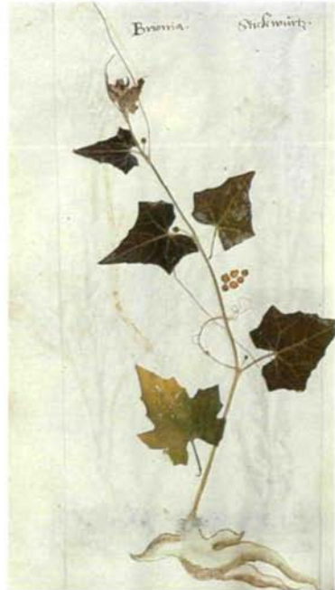
Abbildung 3: Aus dem Herbarium des H. HARDER, 1599: Seite 42, Polygonatum verticillatum (L.) ALL.: Sigillum Salomonis masculus, Weyswurtz das maenlin; Seite 78, Silybum marianum (L.) GAERTN.: Carduus marie, Fech distel; Seite 107, Phaseolus vulgaris L.: Faseoli, Welsch Bonen; Seite 117, Bryonia dioica JACQ.: Brionia, Stickwurtz.