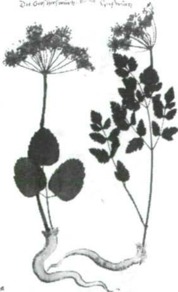
Androselinon Androselinon Androselinon Die Großschwartz-Pflanz. G. 1753.