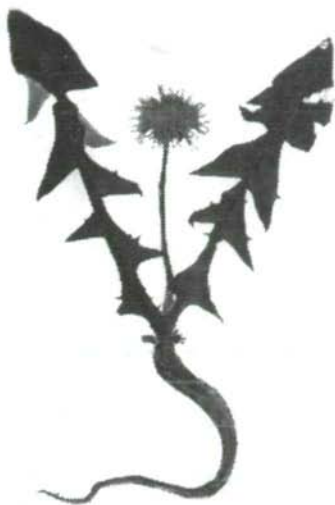
Taraxacum officinale Hieracium - Pflanzen