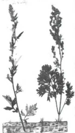
Leindiger Kräuter voneiffen und Sonſerſt find.