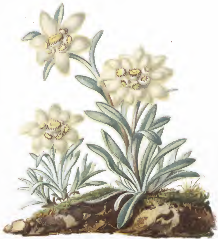
Gnaphalium leontopodium L.