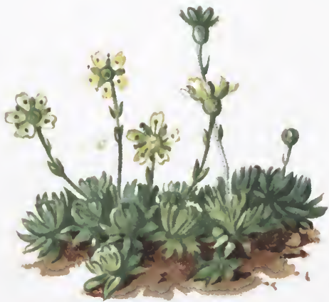
Saxifraga Sequieri Spr.