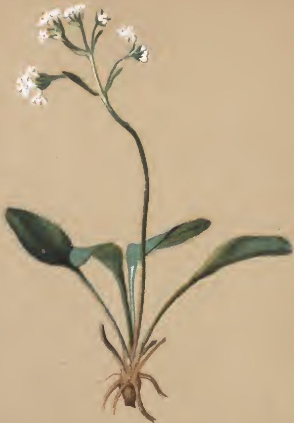
Valeriana saxatilis L.