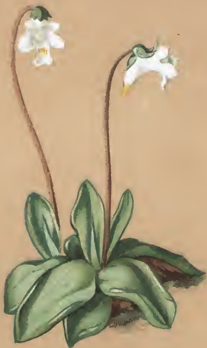
Pinguicula alpina L.