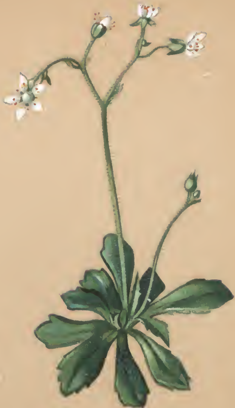
Saxifraga stellaris L.