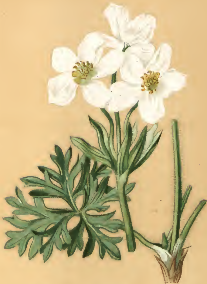
Anemone narcissiflora . L.