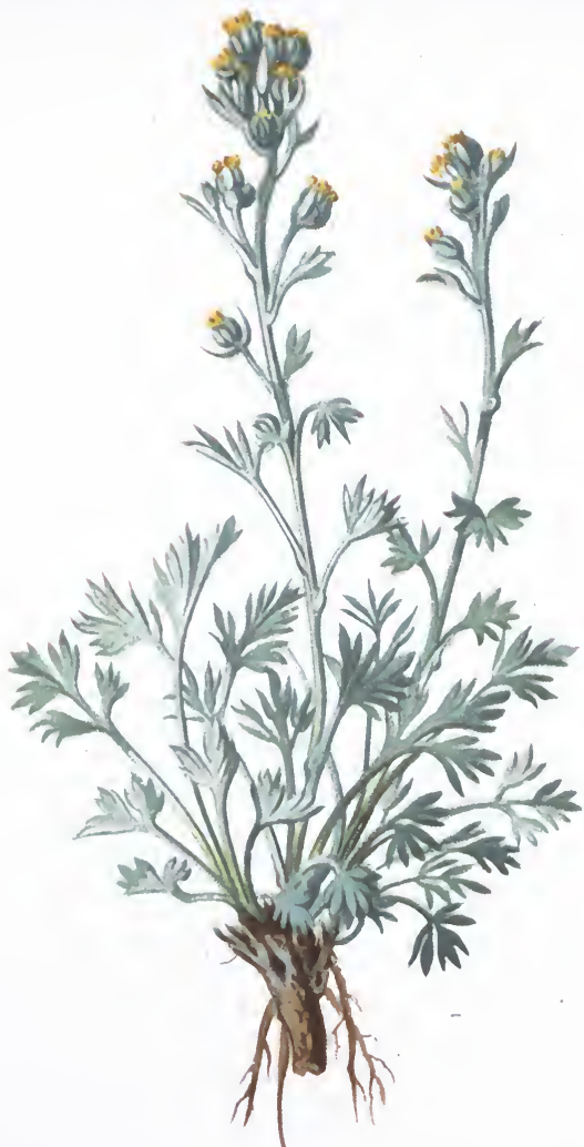
Artemisia Mutellina Vill.