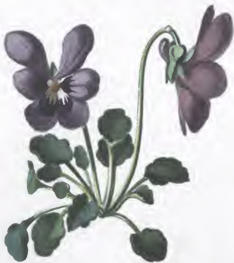
Viola alpina Jacq.