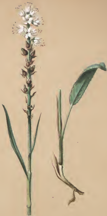
Polygonum viviparum L.