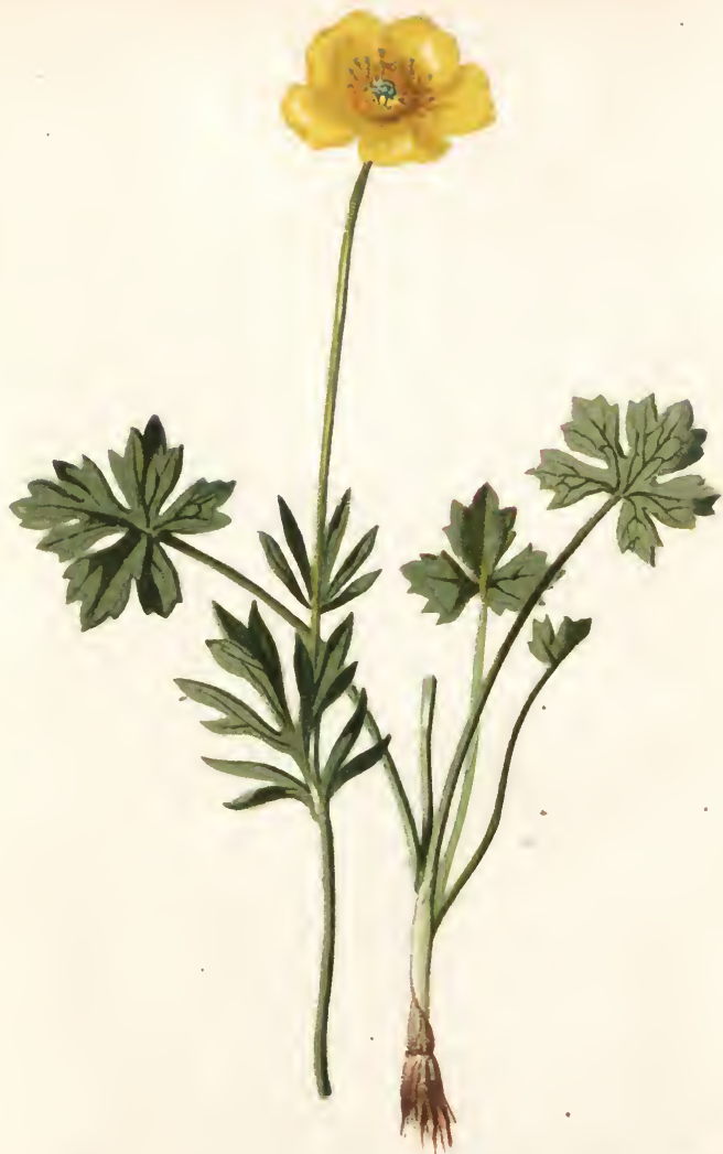
Ranunculus montanus Willd.