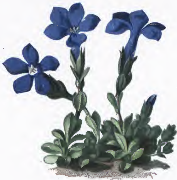
Gentiana bavarica L.