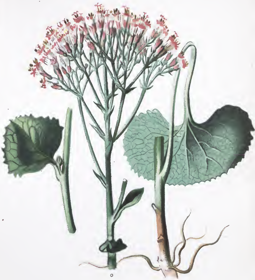
Adenostyles alpina - Bl.