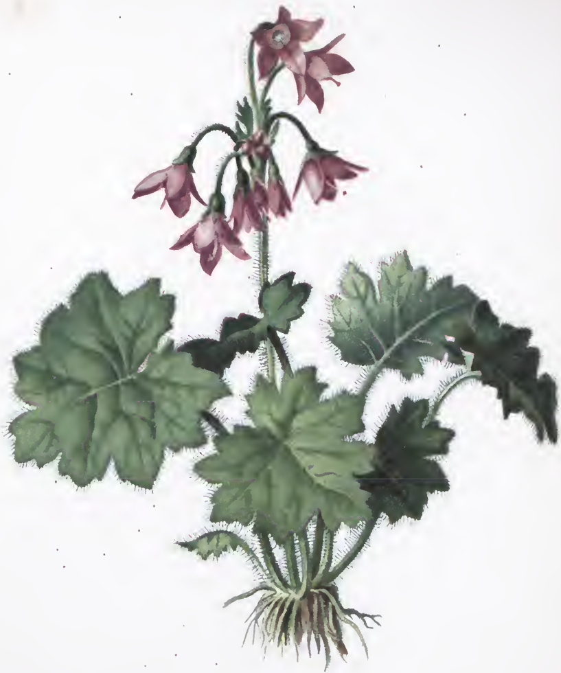
Cortusa Matthioli L.