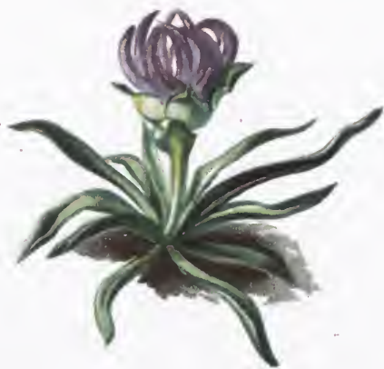
Phyleuma pauciflorum L.