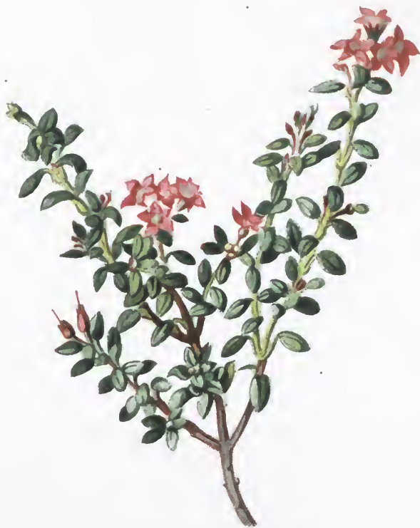
Azalea procumbens L.