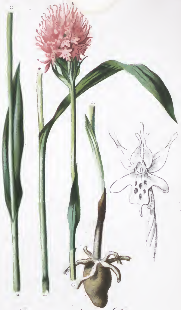
Cichis globosa L.