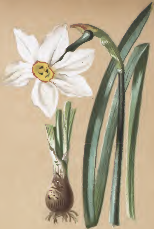
Narcissus poeticus L.