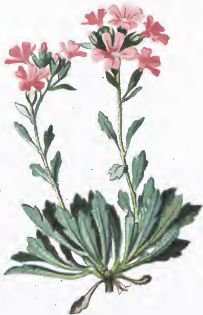
Eriurus alpinus L.