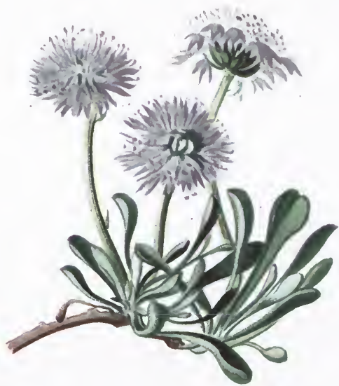
Globularia cordifolia L.