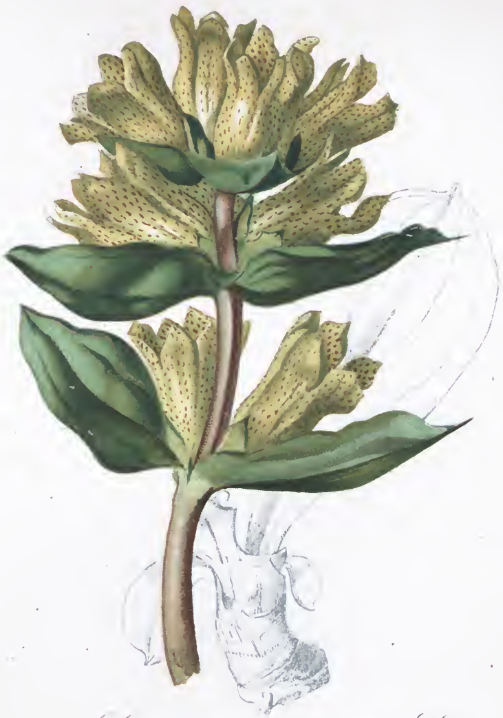
Gentiana punctata L.