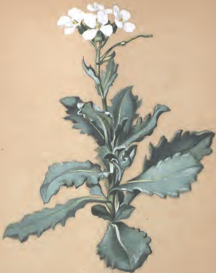
Arabis alpina L.