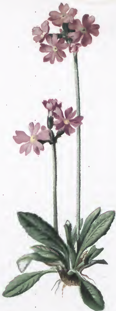
Primula furinosa L.