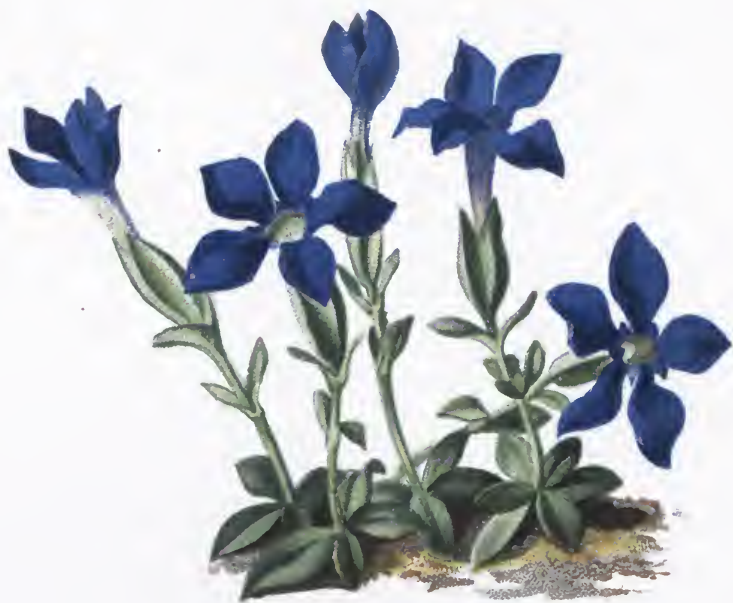
Gentiana verna L.