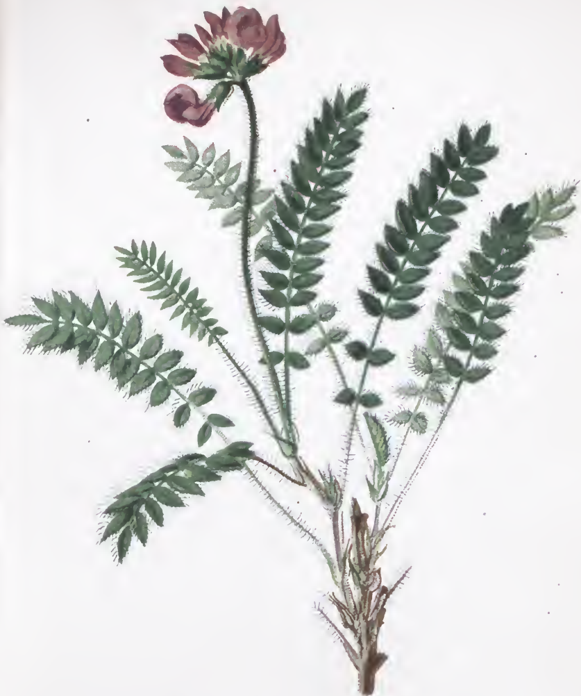
Cryptopsis montana D. C.