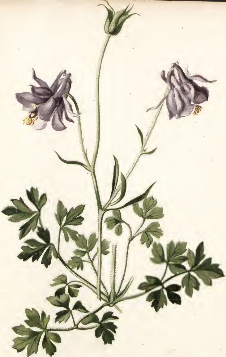
Aquilegia pyrenaica L.