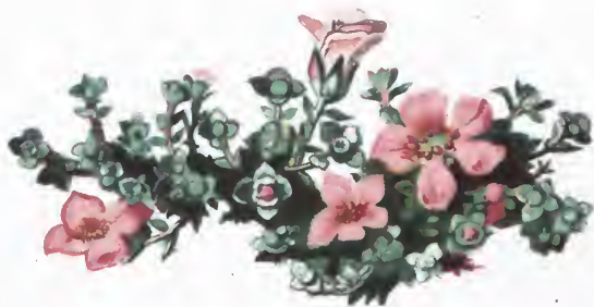
Saxifraga oppositifolia , L.