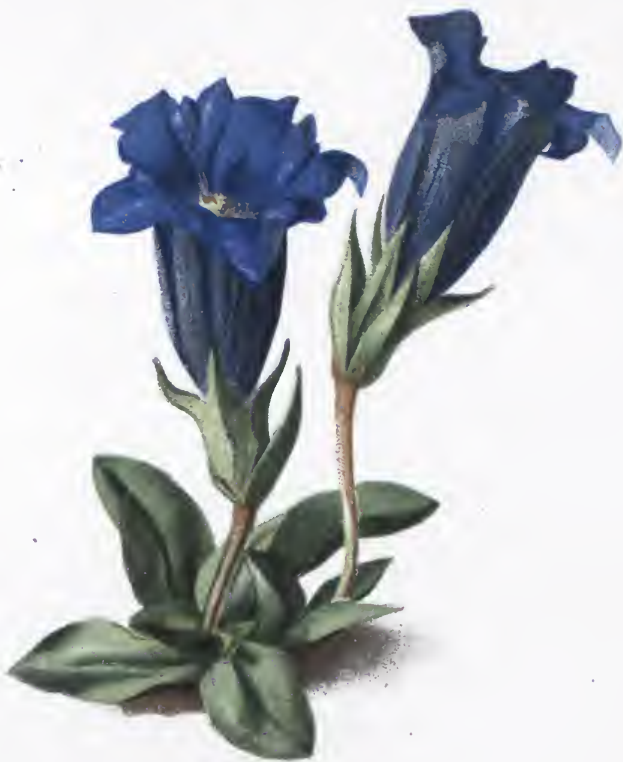
Gentiana acaulis L.