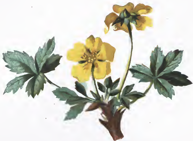
Potentilla aurea L.