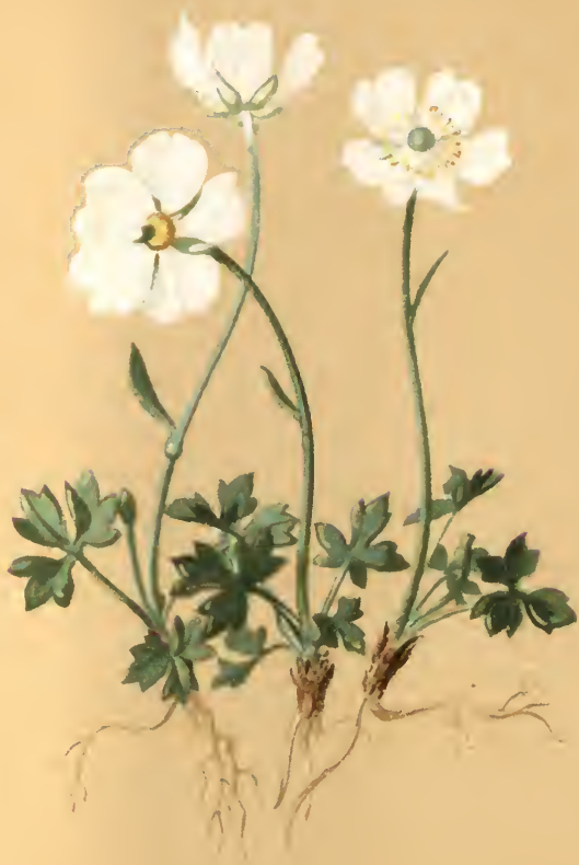
Ranunculus Trausefellneri Hoppe.