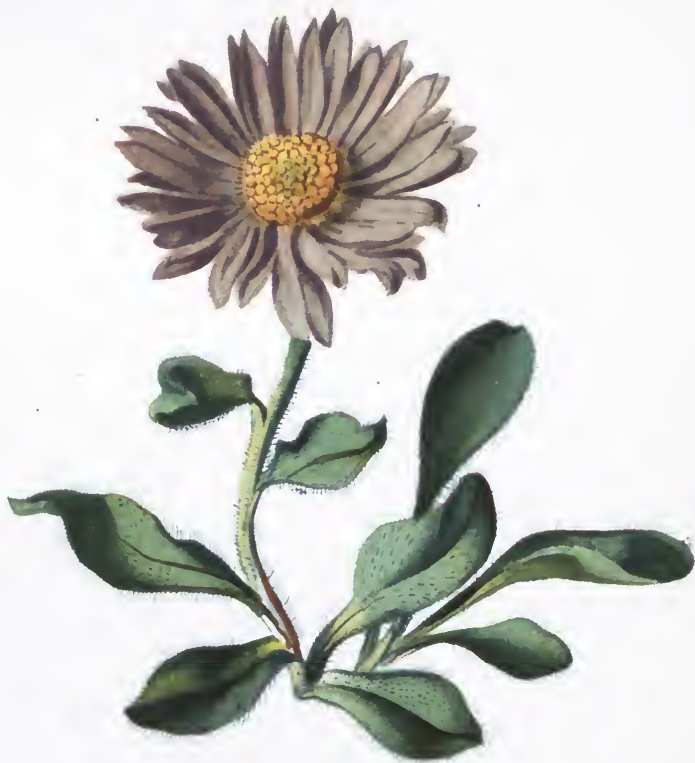
Aster alpinus L.