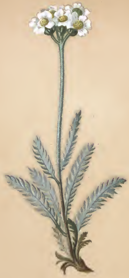
Achillea millefolium L.