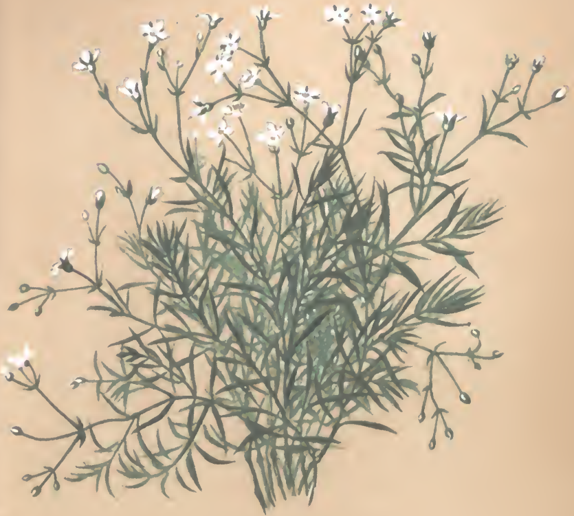
Mollis perfoliata L.