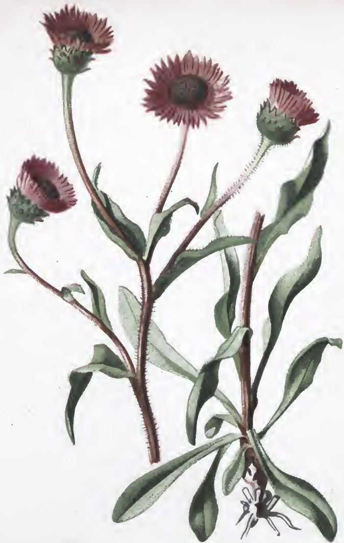
Erigeron alpinus L.