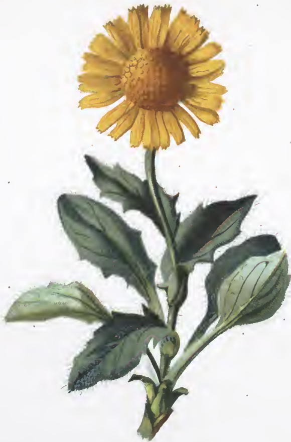
Aronicum Clusii . Koch.