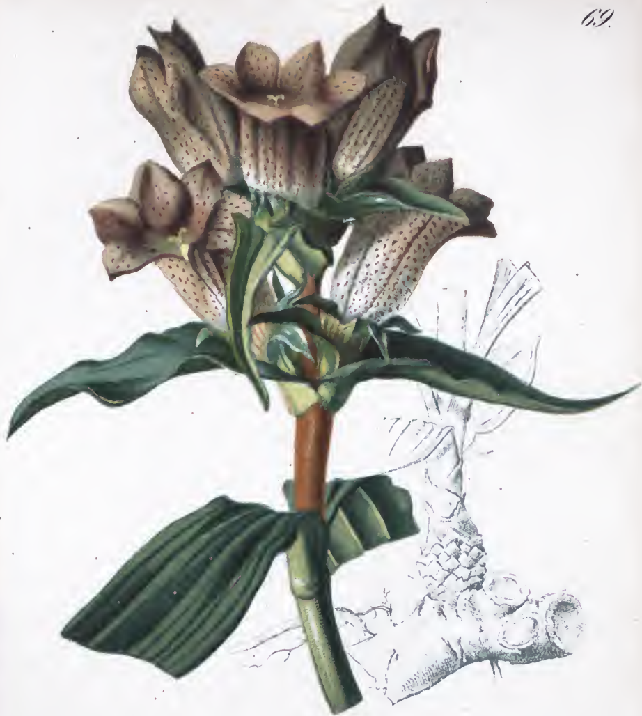
Gentiana purpurea L.