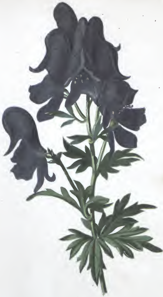
Acconitum Napellus L.