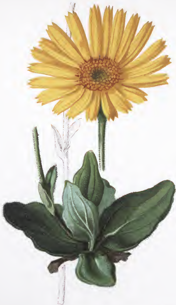
Arnica montana L.