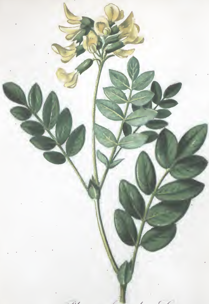
Phaca frigida L.