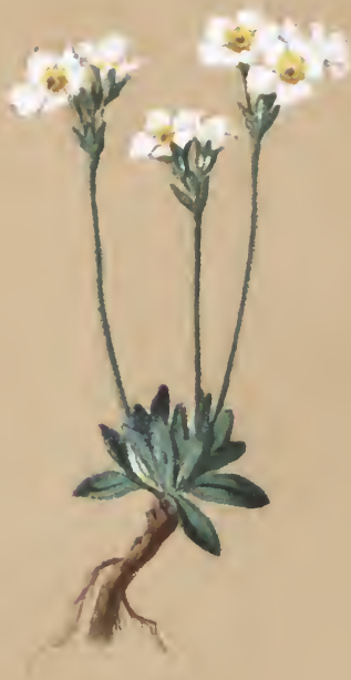
Androsace obtusifolia . Willd.