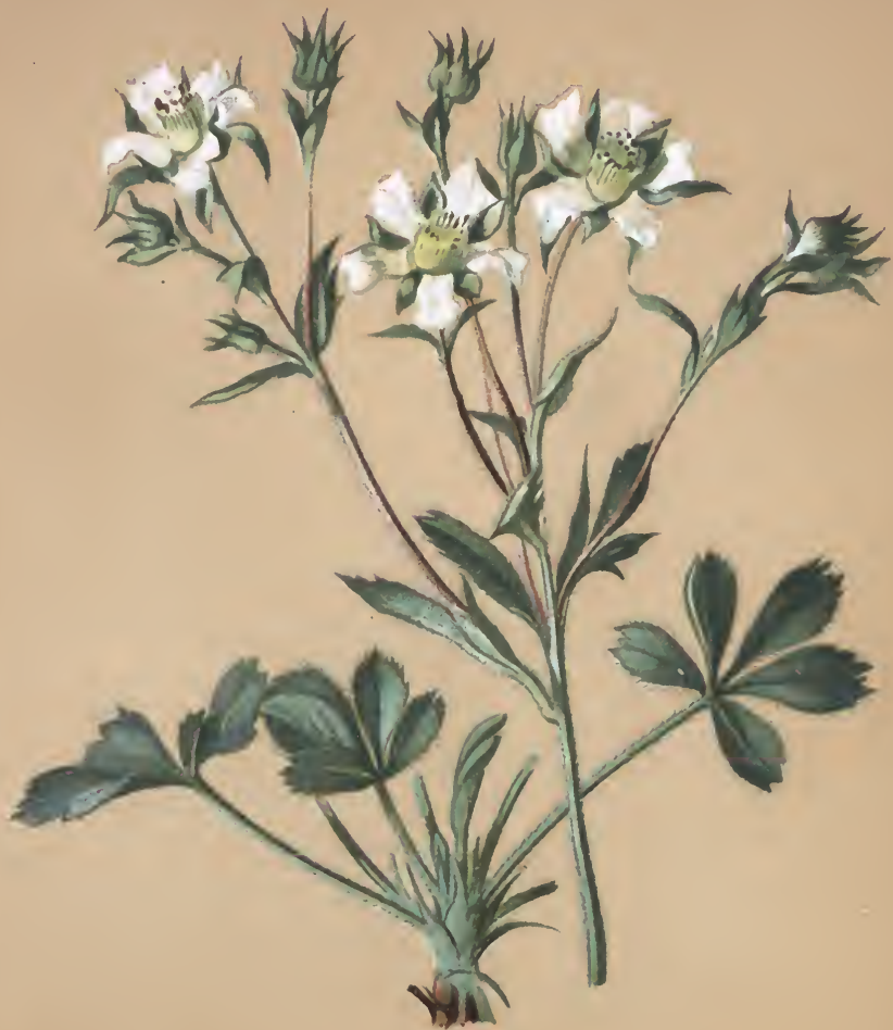
Potentilla caulescens L.