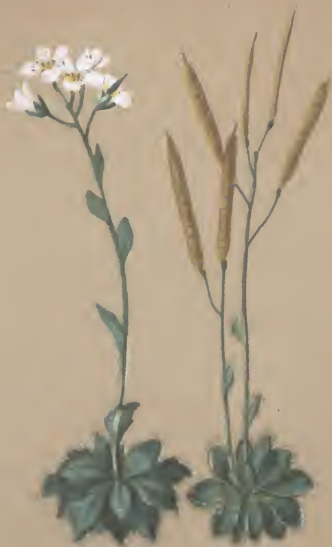
Arabis pumila - Tacy