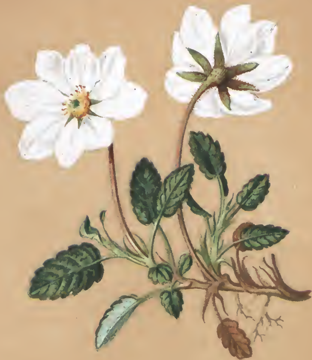
Dryas octopetala L.