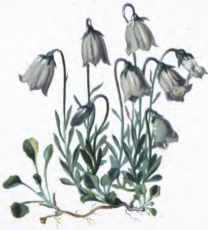
Campanula pusilla Haenk.