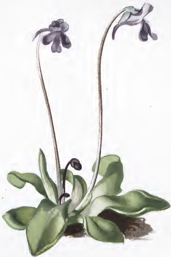
Pinguicula vulgaris L.