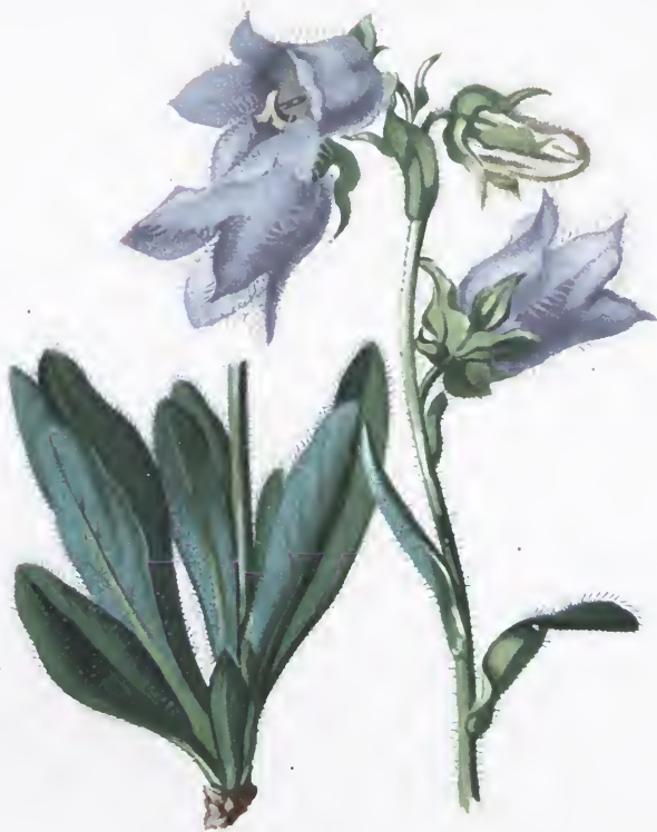
Campanula barbata L.