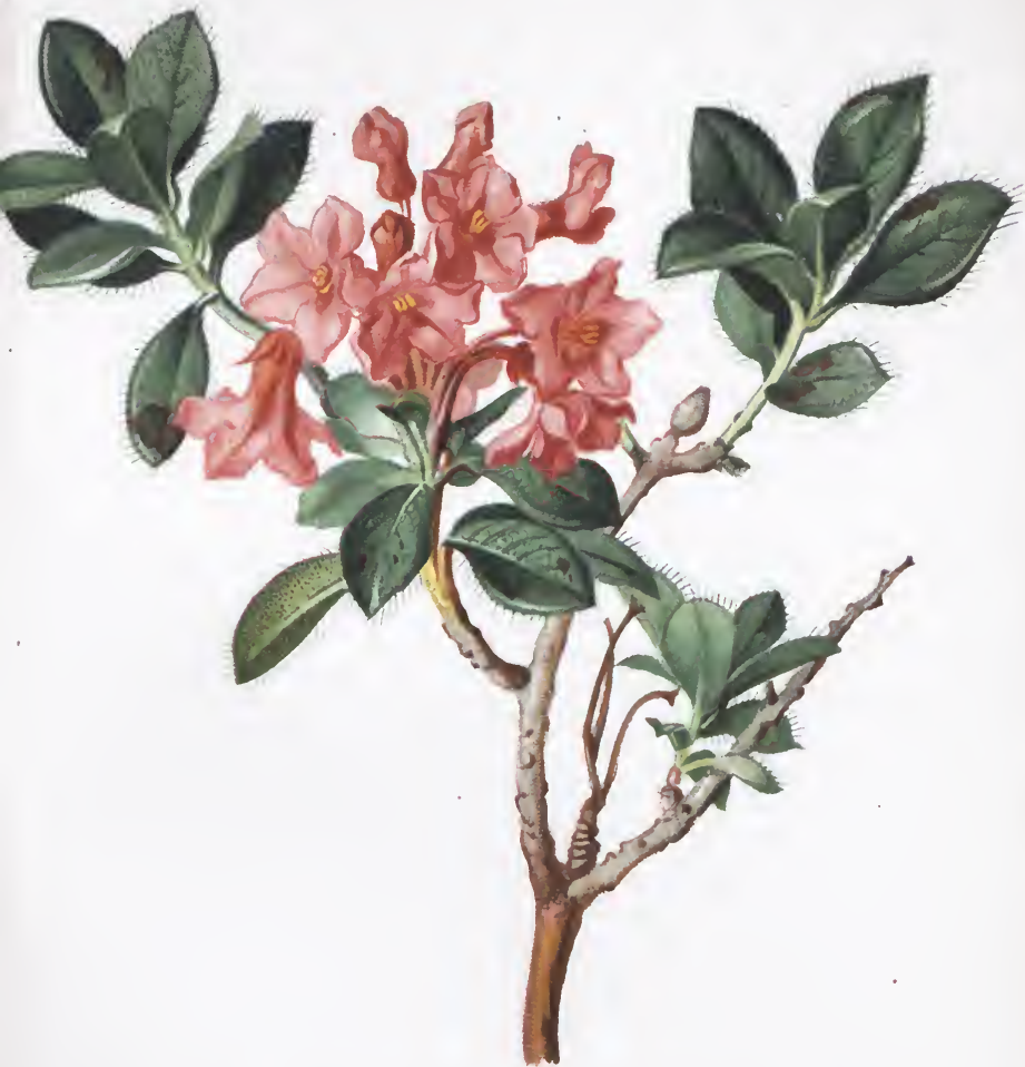
Rhododendron hirsutum L.