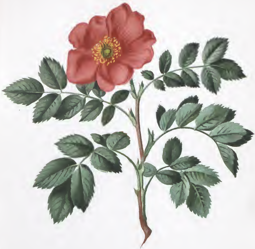
Rosa alpina L.