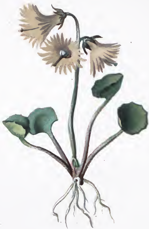
Soldanella alpina L.