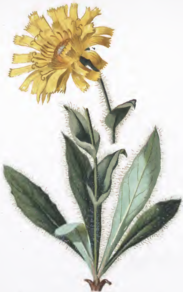
Hieracium villosum Jacq.