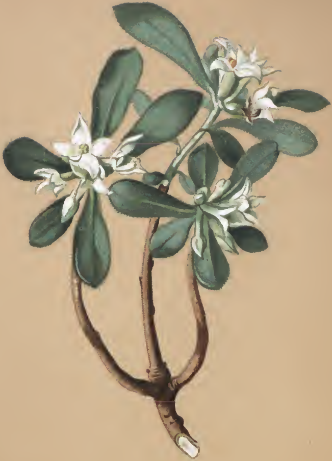
Daphne alpina L.