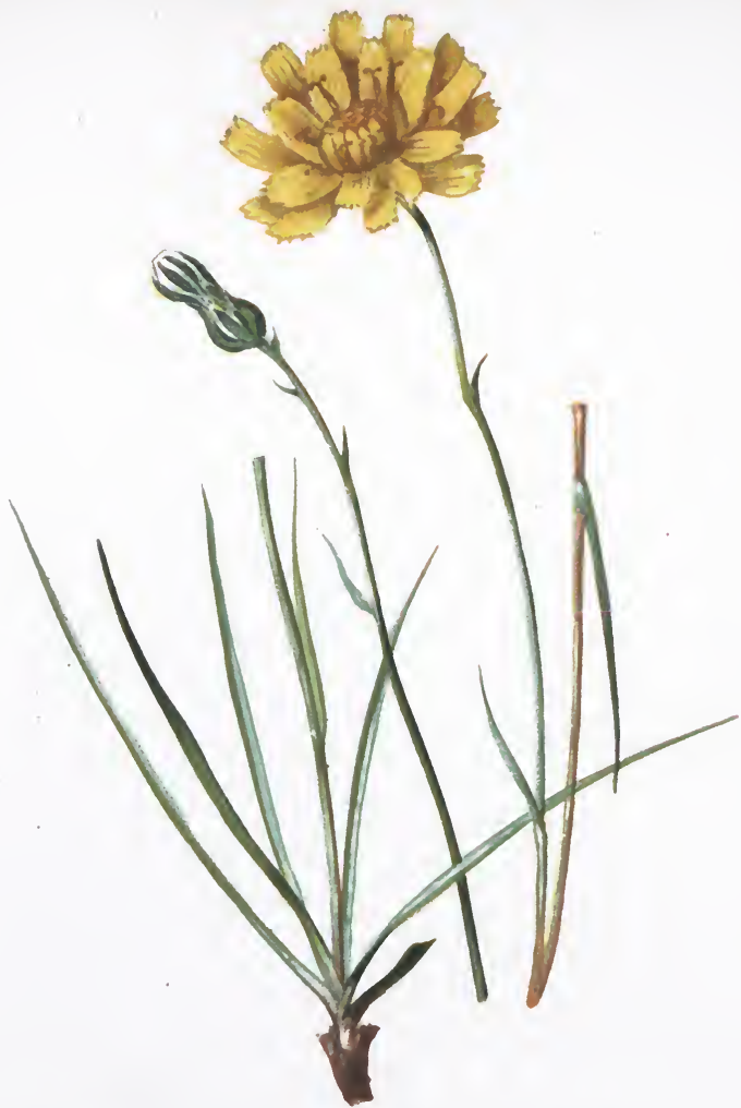
Hieracium staticifolium Vill.