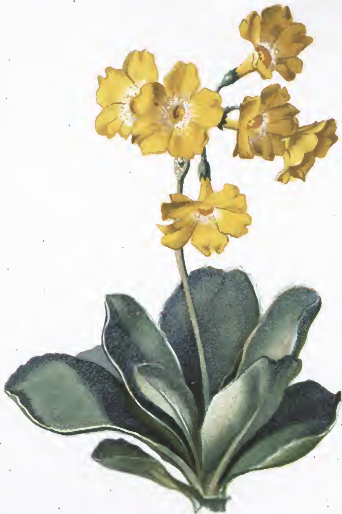
Primula auricula L.