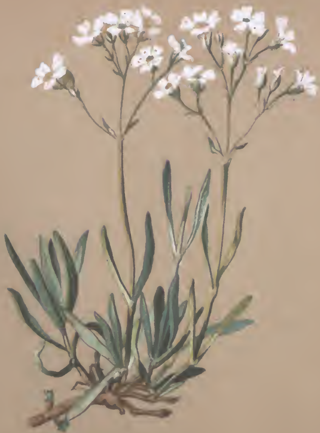
Gypsophila repens L.