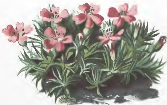
Silene acaulis L.