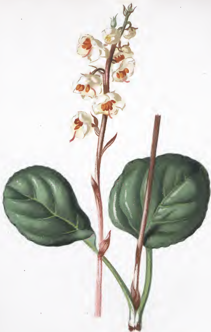
Pyrola rotundifolia L.