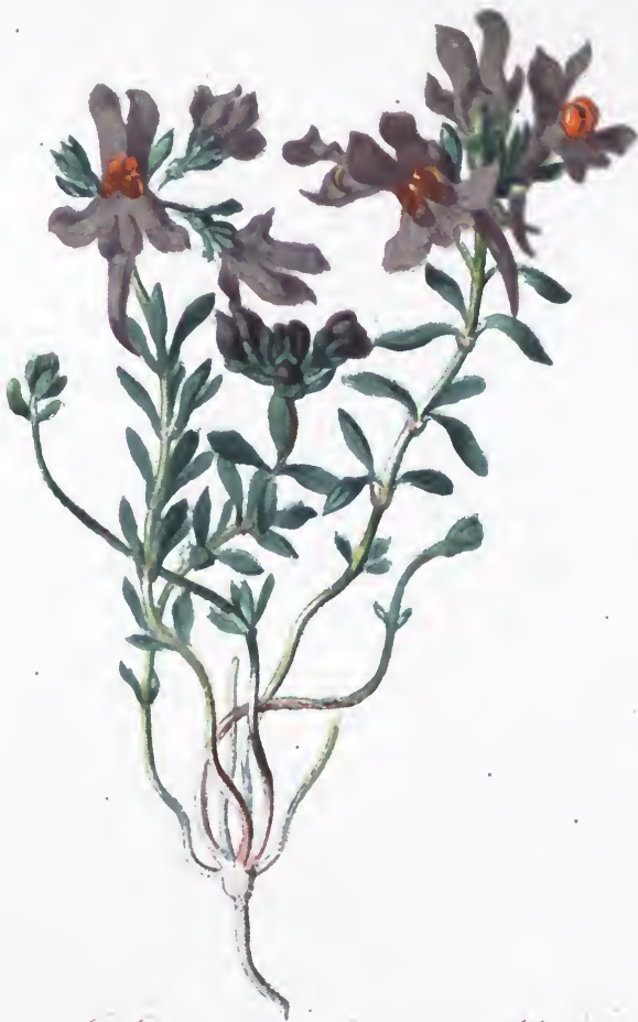
Linaria alpina Mill.