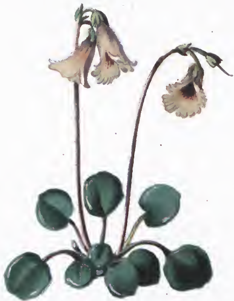
Soldanella pusilla Baumg.