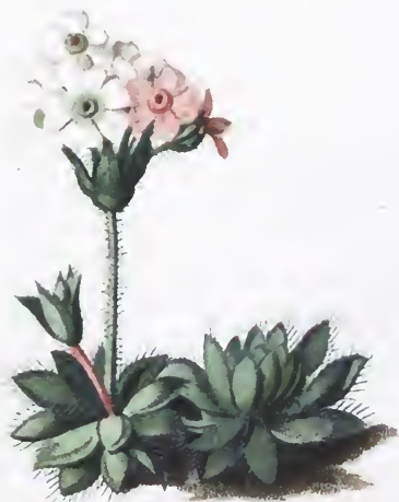
Androsace Chamagjasme. Host.