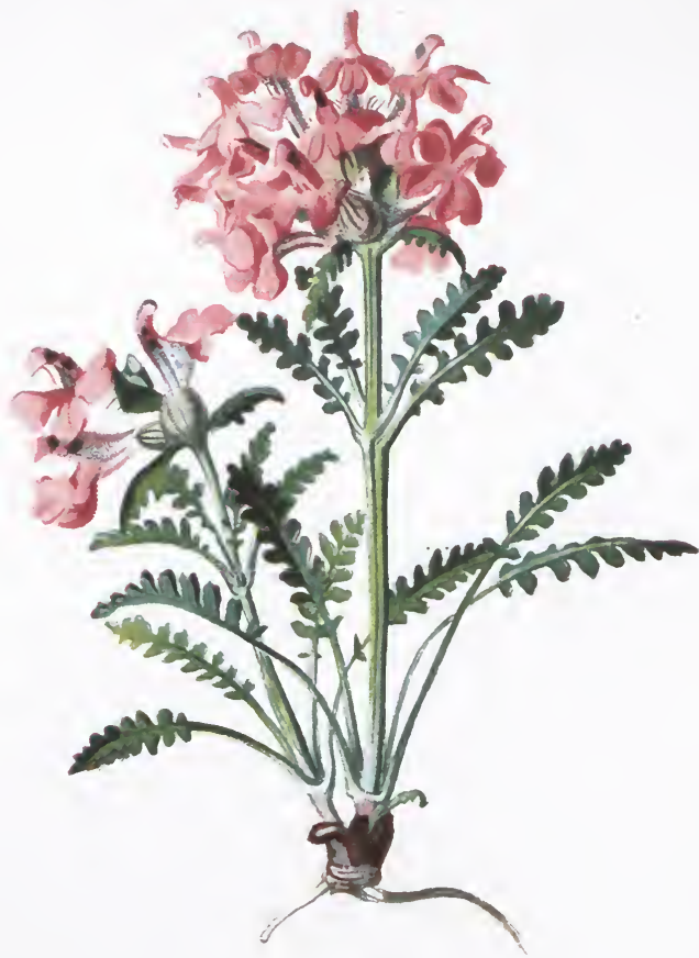
Pedicularis verticillata L.