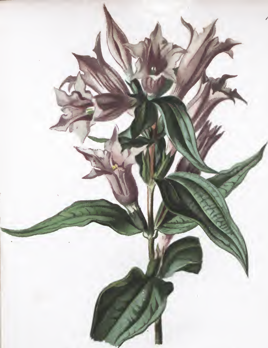
Gentiana asclepiadea L.