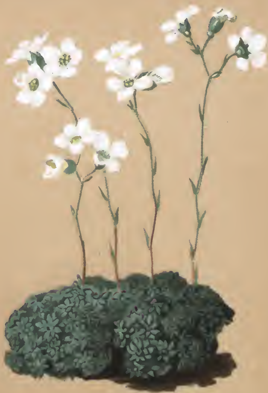
Saxifraga coccinea L.