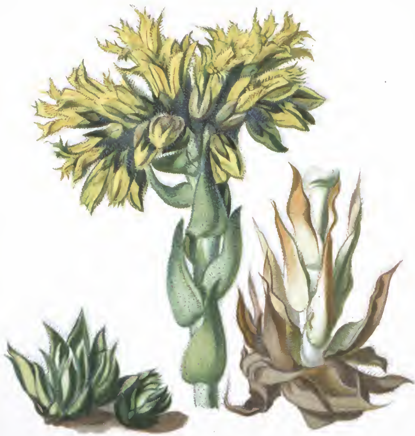
Semperivium hirtum L.