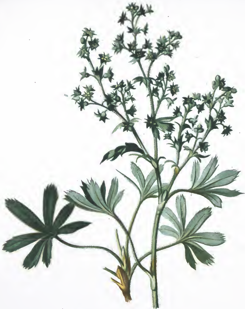
Alchemilla alpina L.