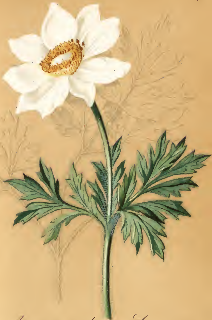
Anemone alpina L.