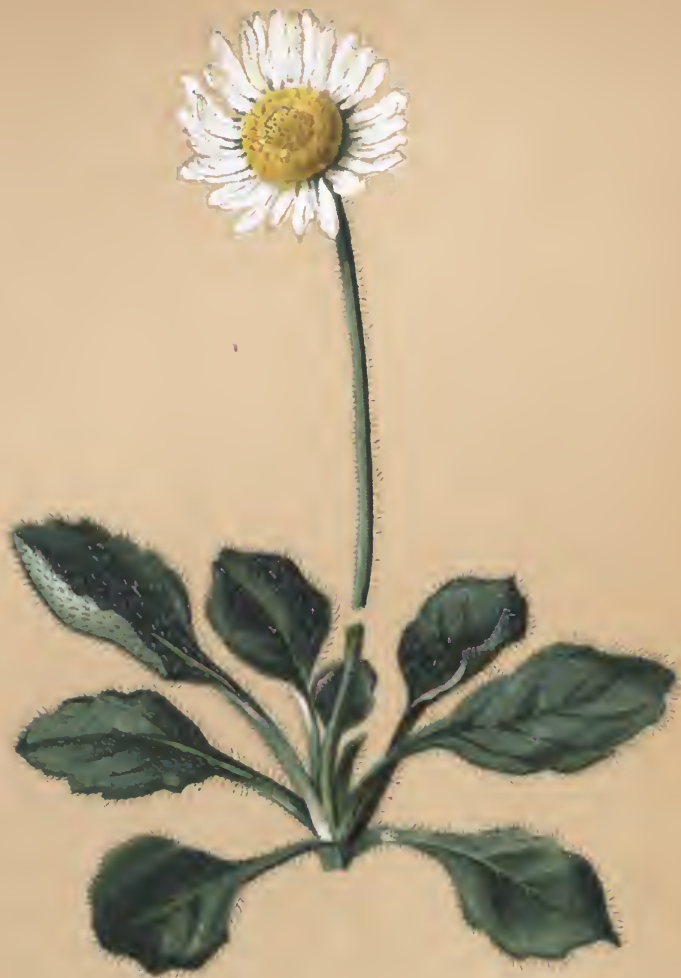
Bellidiastrum Micheliï Cass.