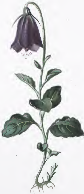
Campanula pulla L.