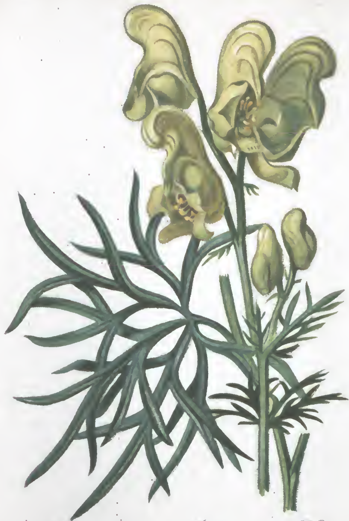
Aconitum Anthora L