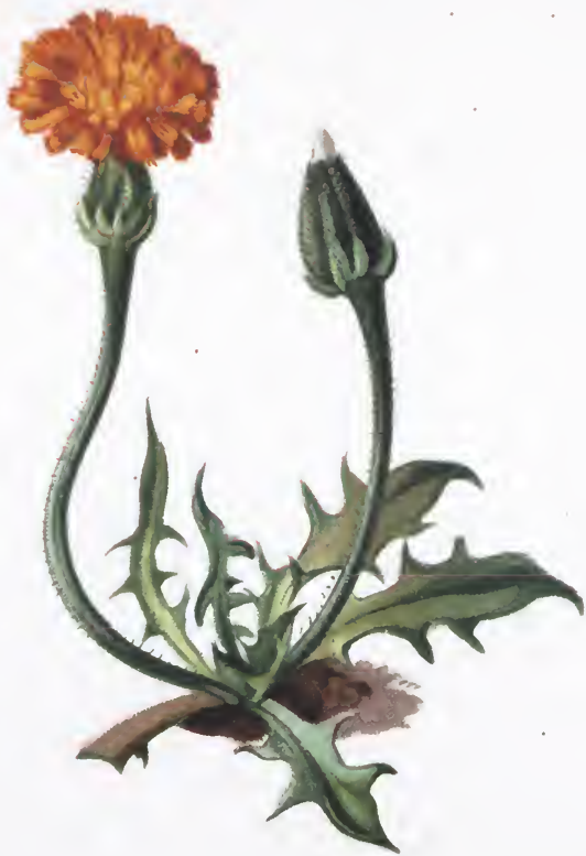
Leontodon pyrenaicus . Gouan.