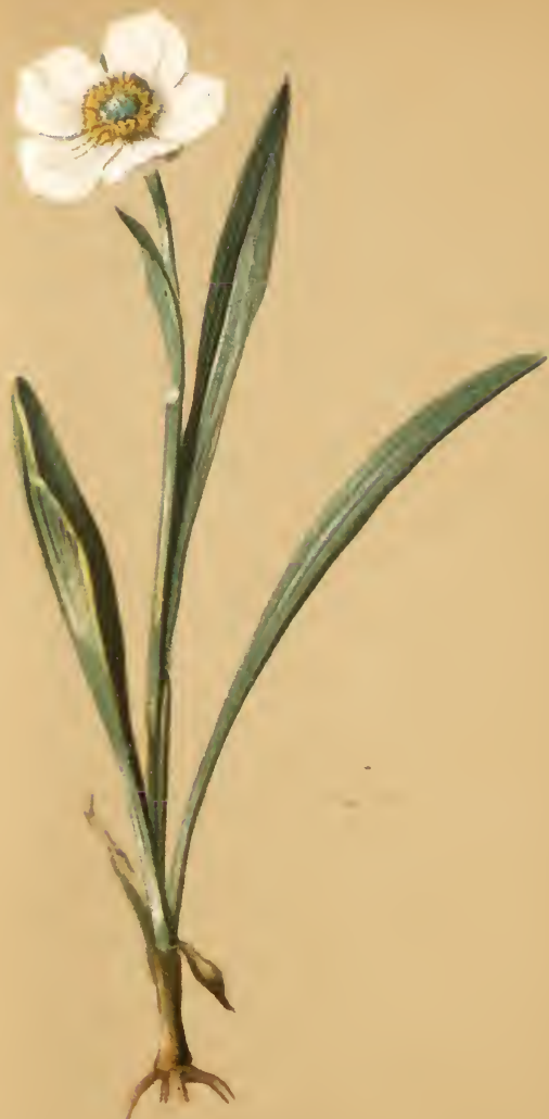
Ranunculus pyrenaeus L.