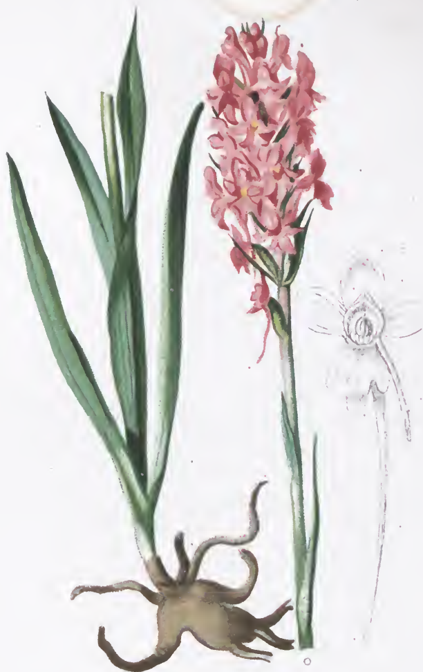
Gymnadenia conopsea - R. Br.