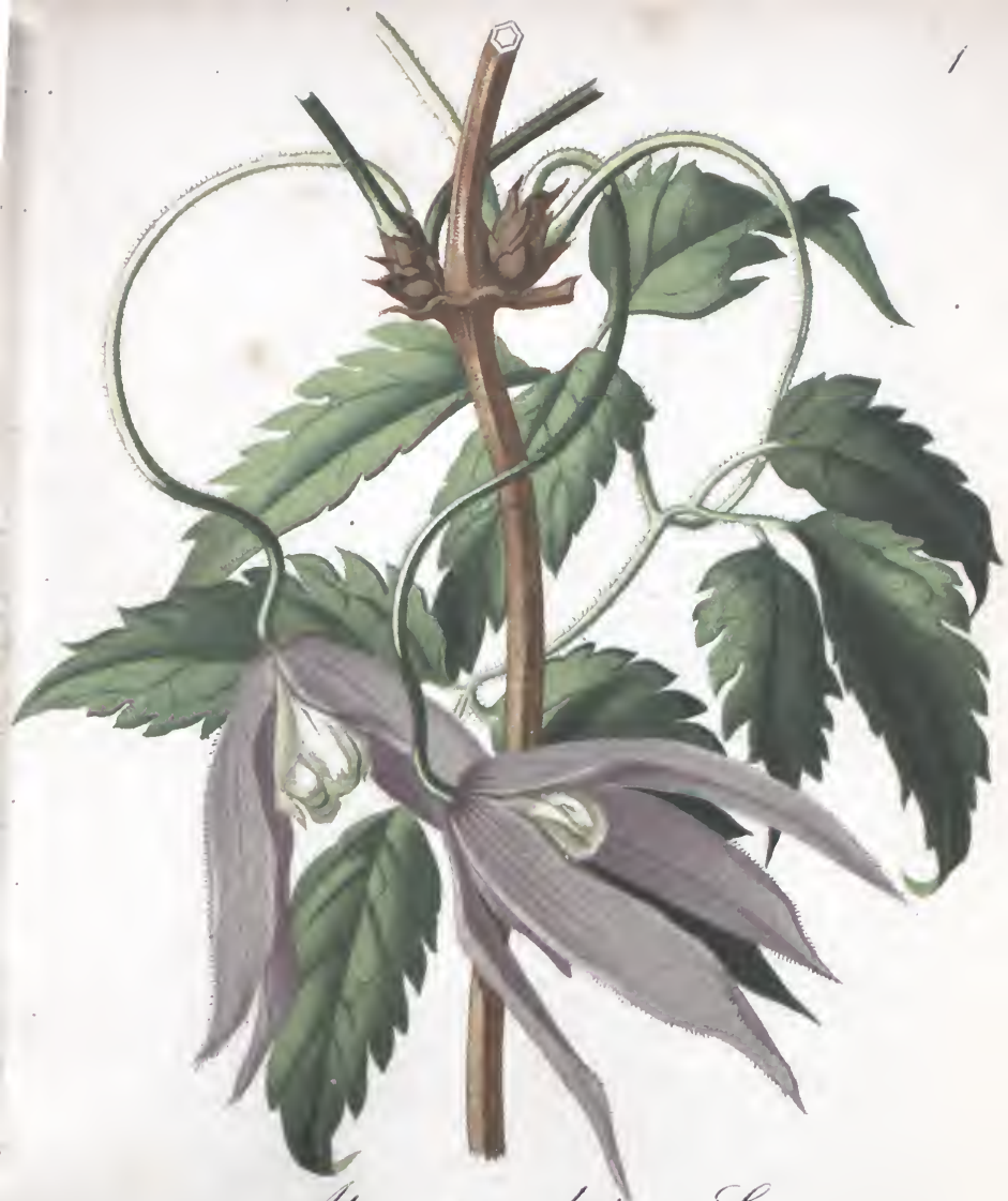
Atragene alpina L.