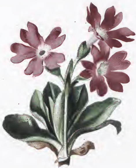
Primula spectabilis Frall