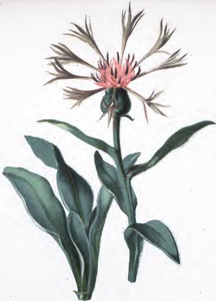
Centaurea montana L.