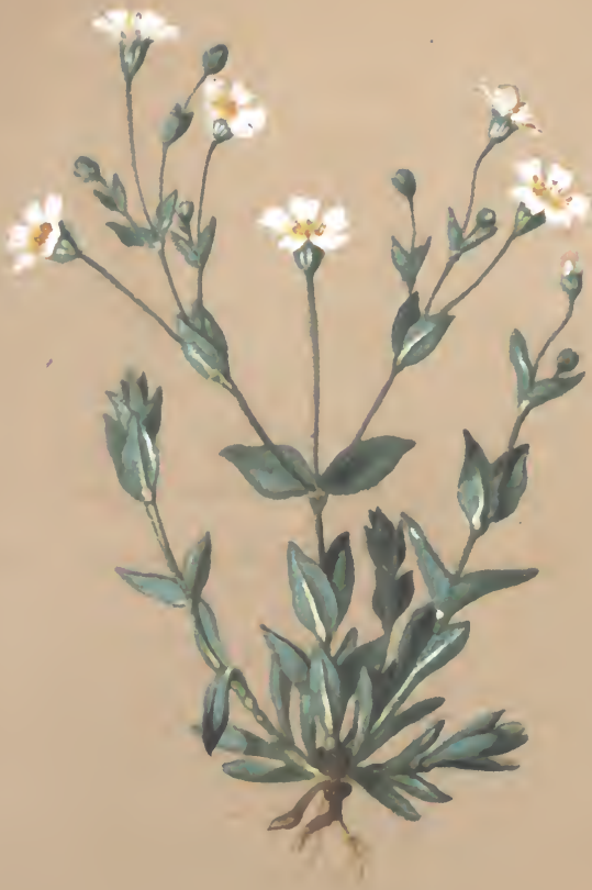
Silene rupestris L.