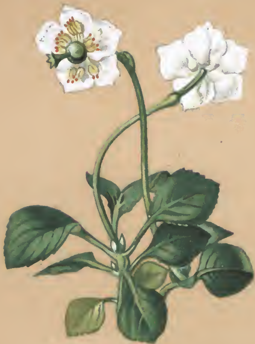
Pyrola uniflora L.