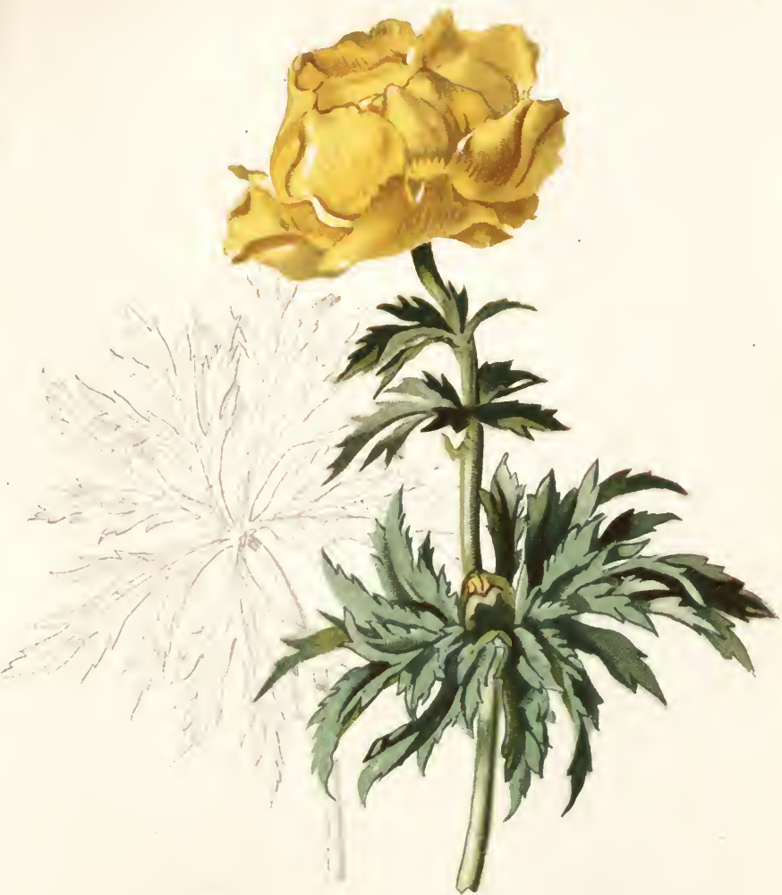
Trollius europaeus L.