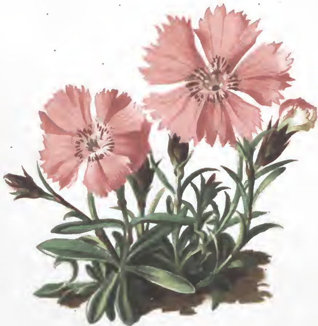
Dianthus alpinus L.