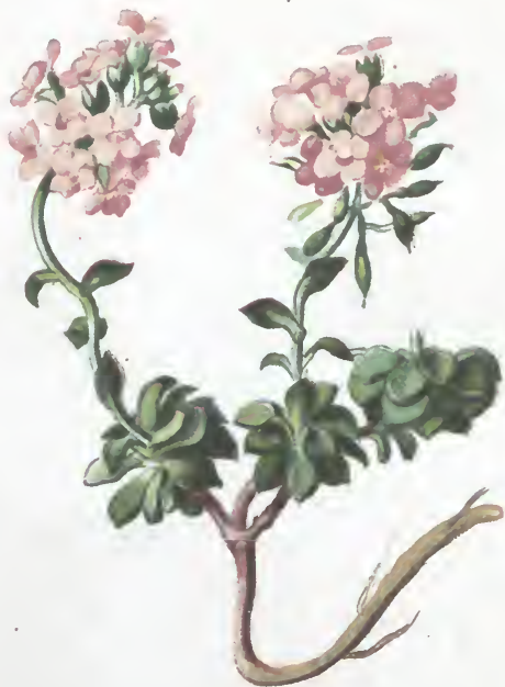
Thlaspi rotundifolium Gaud.