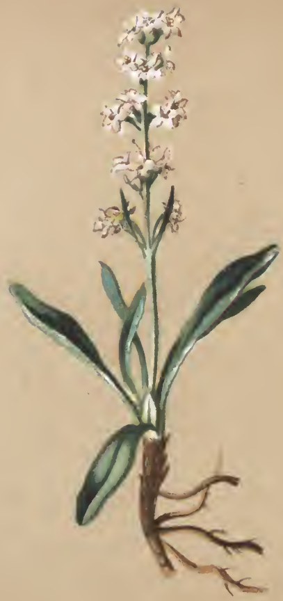
Valeriana. celtica. Turcy.