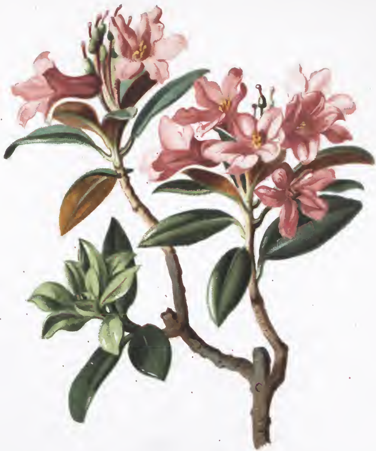
Rhododendron ferrugineum L.