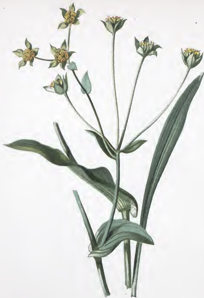
Bupleurum graminifolium Vahl.