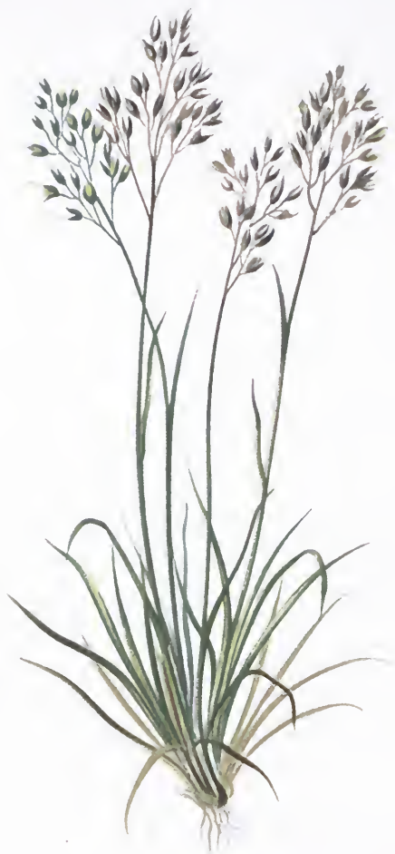
- Agrostis rupestris - All