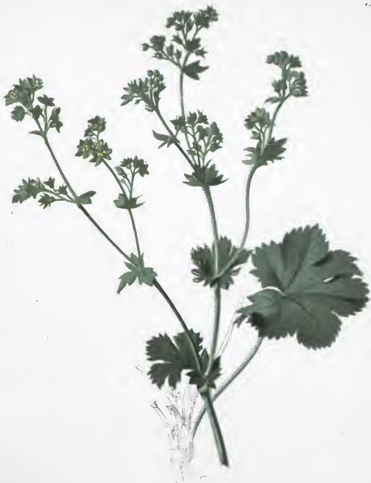
Adonis vernalis Pich.