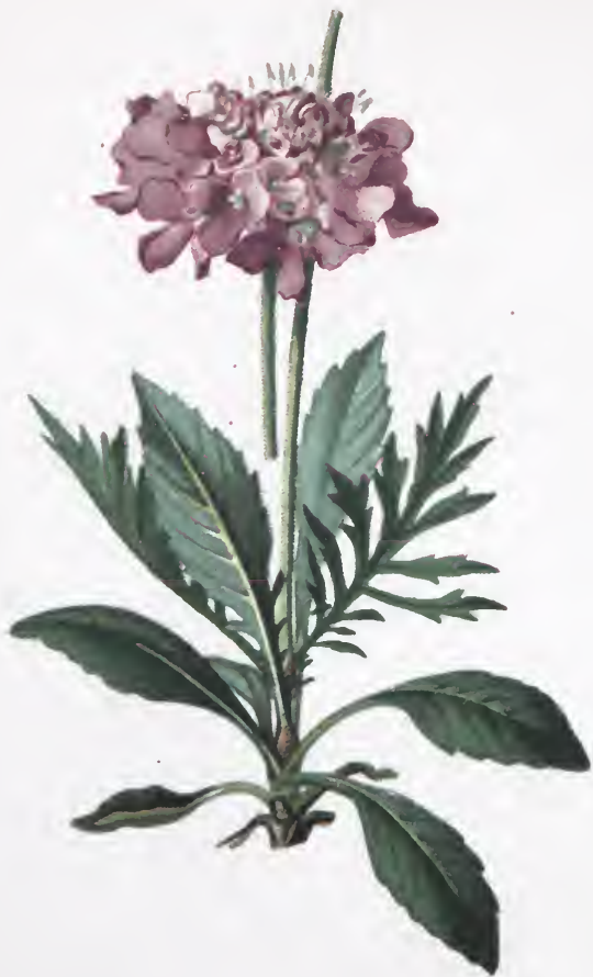
Scabiosa lucida Vill.