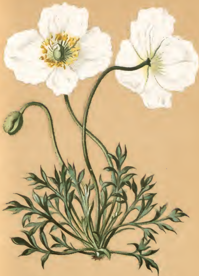
Papaver alpinum L.