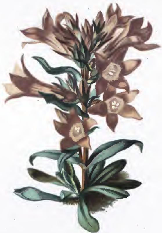
Gentiana obtusifolia Willd.