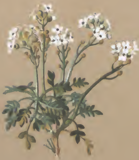
Hutchinsia alpina . R. Br.