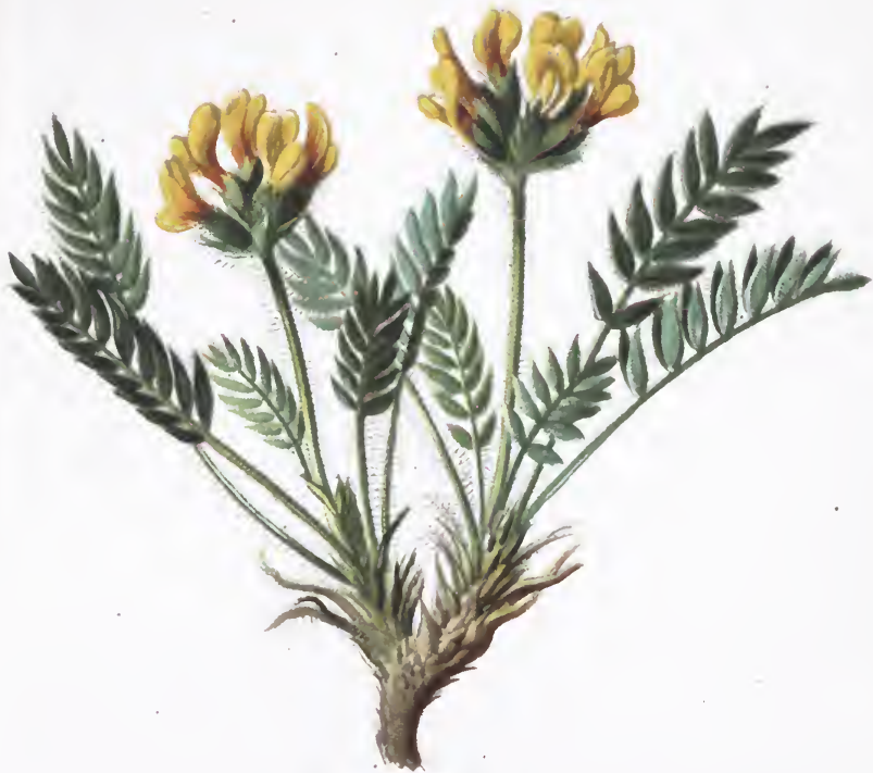
Ononis spinosa L.