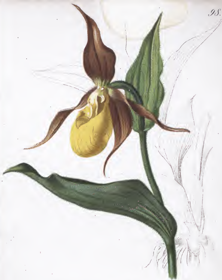
Cypripedium Calceolus L.