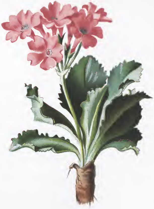
Primula villosa , Jacq.