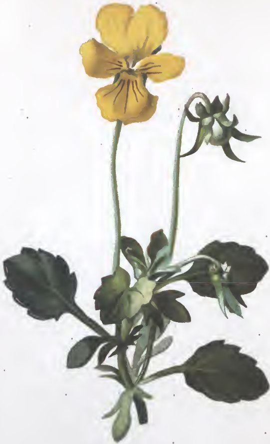
Viola lutea Sm.