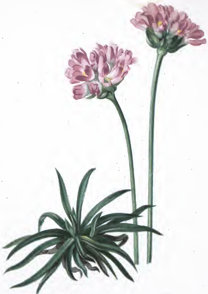
Armeria alpina L.