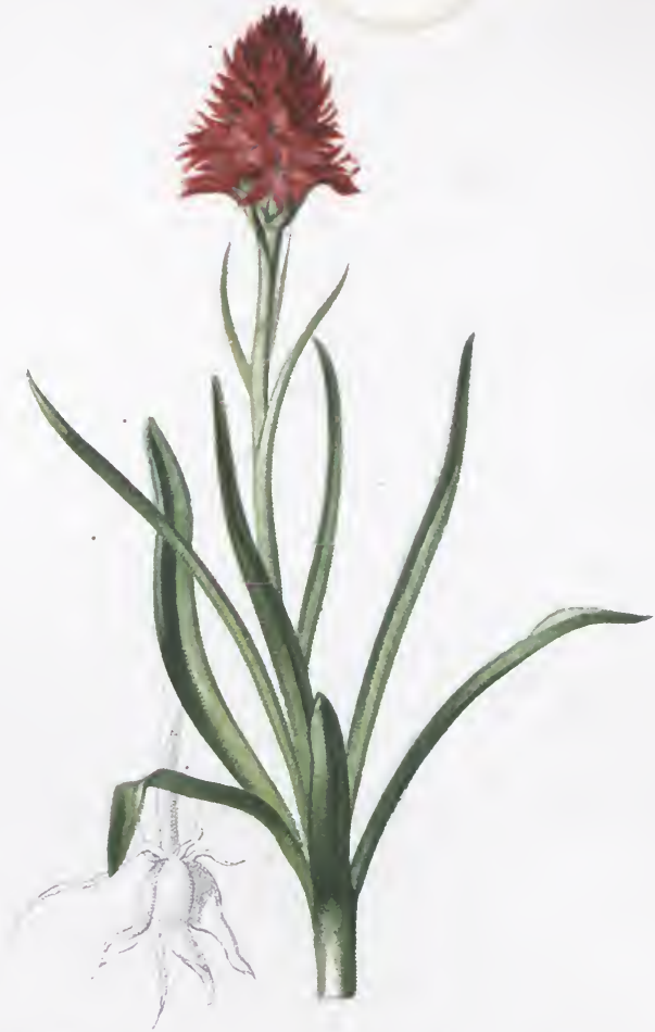
Nigritella angustifolia Rich.