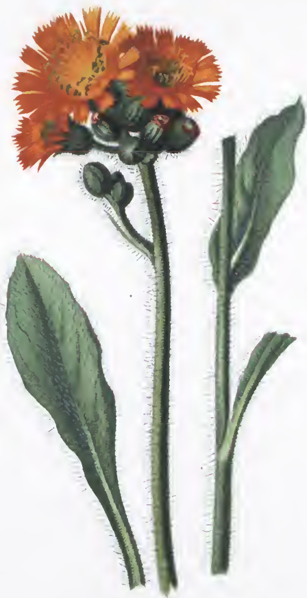
Hieracium aurantiacum L.