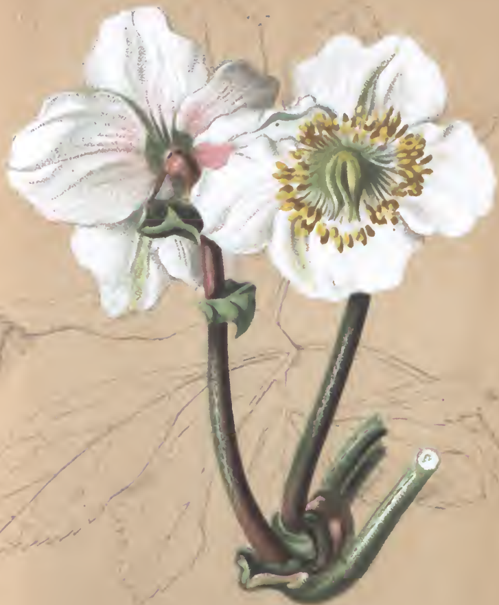
Helleborus niger L.