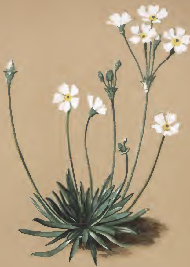
Androsace lactea L.