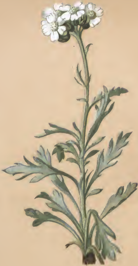
Achillea Clavenae L.