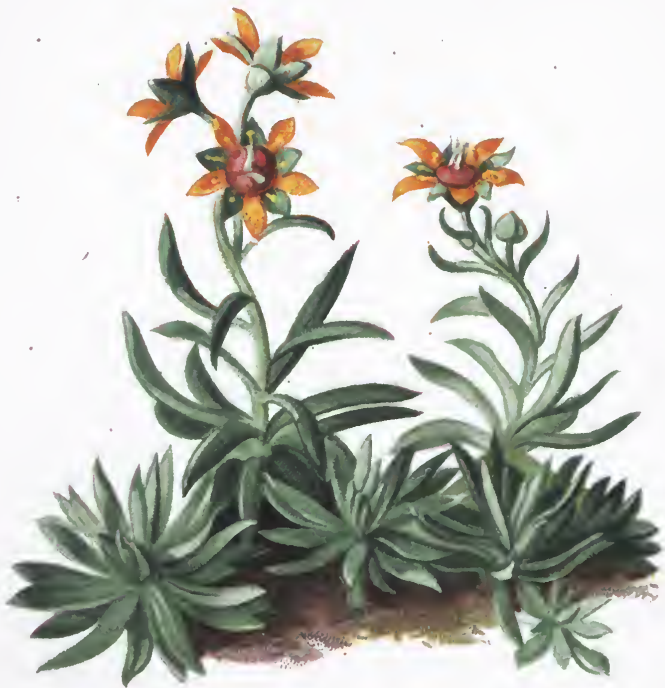
Saxifraga aizoides L.